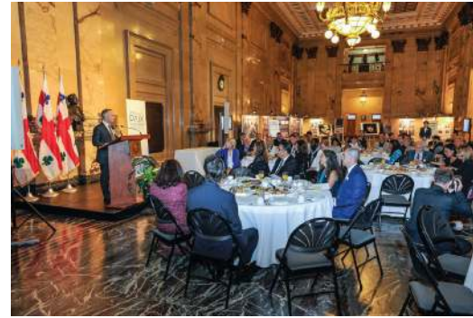
Célébration de la Journée internationale de la paix 2015

En 2016 , 20 activités, avec l'appui de 50 partenaires