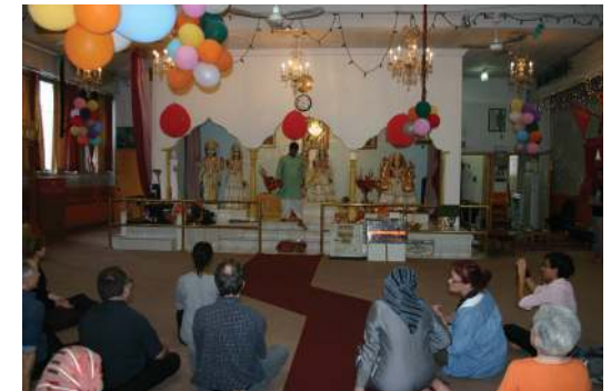
Parcours interreligieux de Villeray, 2015